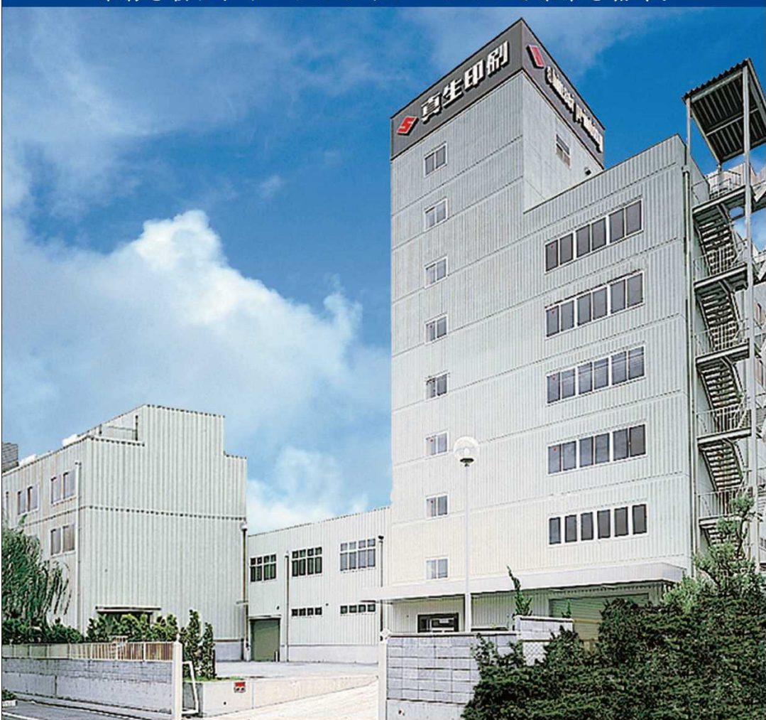
堺デザイン協会 賛助会員 / 真生印刷株式会社