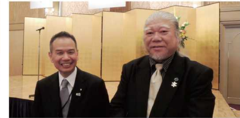
堺市 市長公室 射手矢修一郎 秘書部長(現 堺区長)