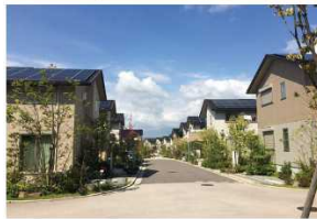
スマ、エコタウン晴美台