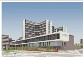
堺市立総合医療センター・堺市消防局救急ワークステーション・堺市子ども急病診療センター