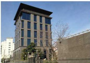
EH 第三ビル（飯智倶楽部）