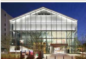
堺市立歴史文化にぎわいプラザ（さかい利晶の杜）