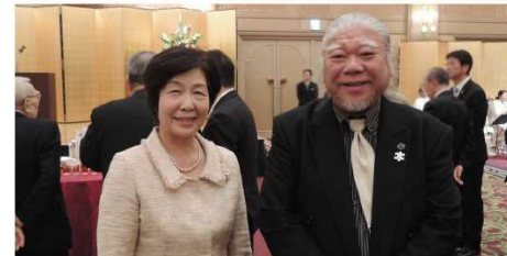
元国土交通大臣 衆議院議員 北側一雄 令夫人