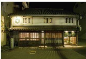
茶寮 つぼ市製茶本舗