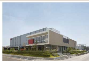
トラスコ中山 プラネット大阪