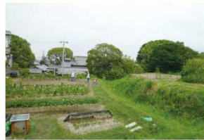
地域まちおこしプロジェクト「楽畑」