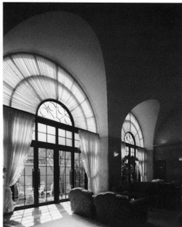
フィレンツェライフ青山・ロビー

今世紀最高のデザインはスペイン・バルセロナに建設中の教会「聖家族教会—サグラダ・ファミリア」ではないだろうか。1884年から建設が始まって現在に至り、完成までにあと150年とも200年とも必要といわれている。信者の浄財を集めながらの工事であることにもよるが、30年程で建て替えるのを当たり前と考えている我々に、何かを語りかけてくるプロジェクトというべきだろう。