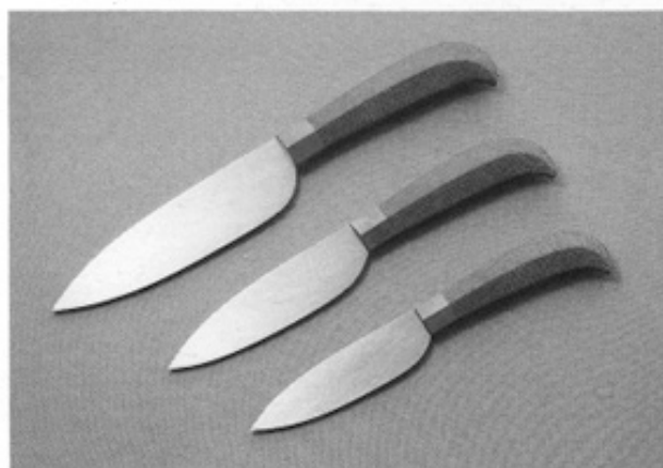
▲グランプリを受賞した【KITCHEN KNIFE】

おり、作り手のポリシーや目的が具体的にあって、作者の「顔」が見える。全体的に既存の刃物のイメージを超えたデザインのものも多く、完成度の高いものや、今後の可能性を感じさせるものである。特にグランプリに選ばれた作品