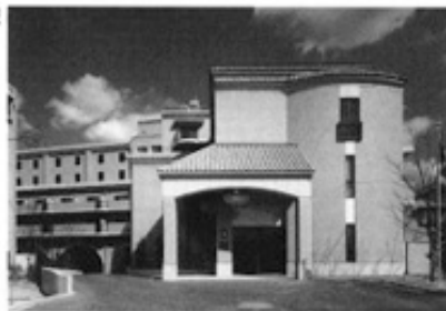
フィレンツェライフ青山・外観

上の子供が今春大学4年生、下の子供がやはり今年の4月から高校3年生の4人暮らし。まだまだ物入りが続くと考えていた矢先、中野孝次著の「清貧の思想」を読んだ。元阿弥光悦・妙秀親子、鴨長明、良寛、池大雅、与謝蕪村、吉田兼好、松尾芭蕉等、彼等の生きざまはまさに物欲から解放された、真の自由人、人は生きてゆく上で必要欠くべからざるだけの物があれば、それ以外の物など何も持たないのが精神活動を自由にするという説。それにどんなものでも売ればよしとしてきた原理や、経済的効率至上主義をもって生産するのを誰も疑わなかった今の物質文明には誤りがあったのではないかという論。もやもやした自分の中にひとすじの清水が